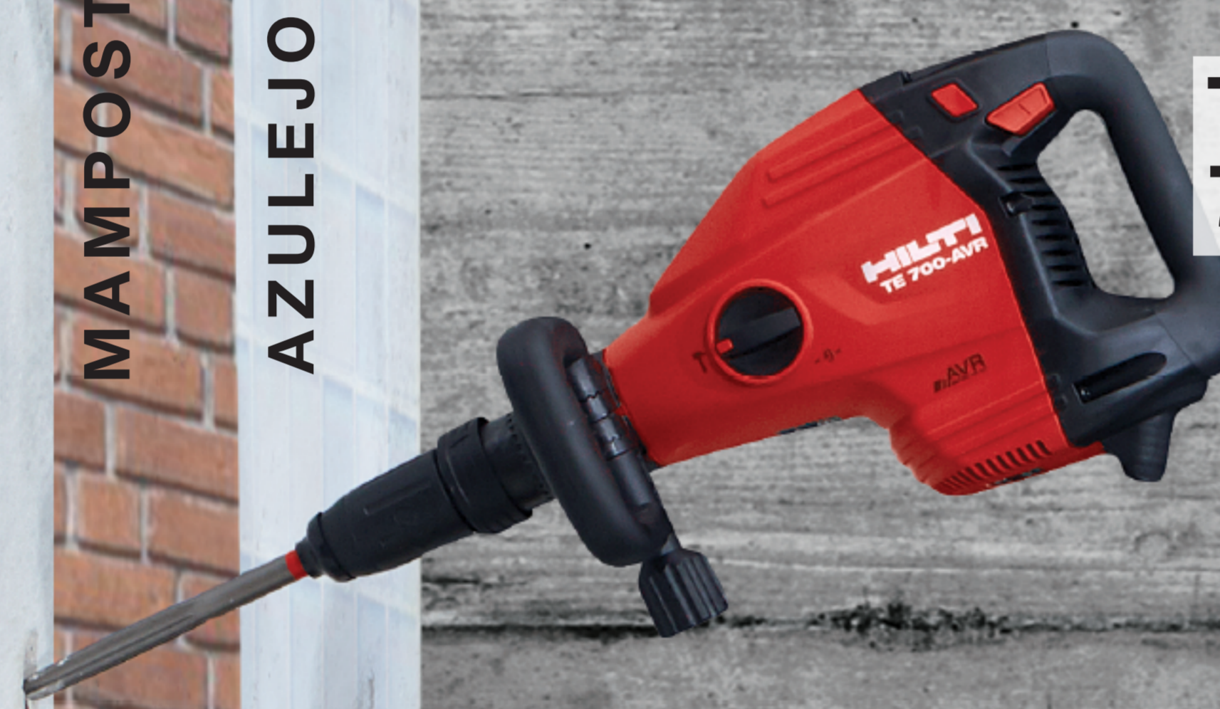
TE 700 7Kg