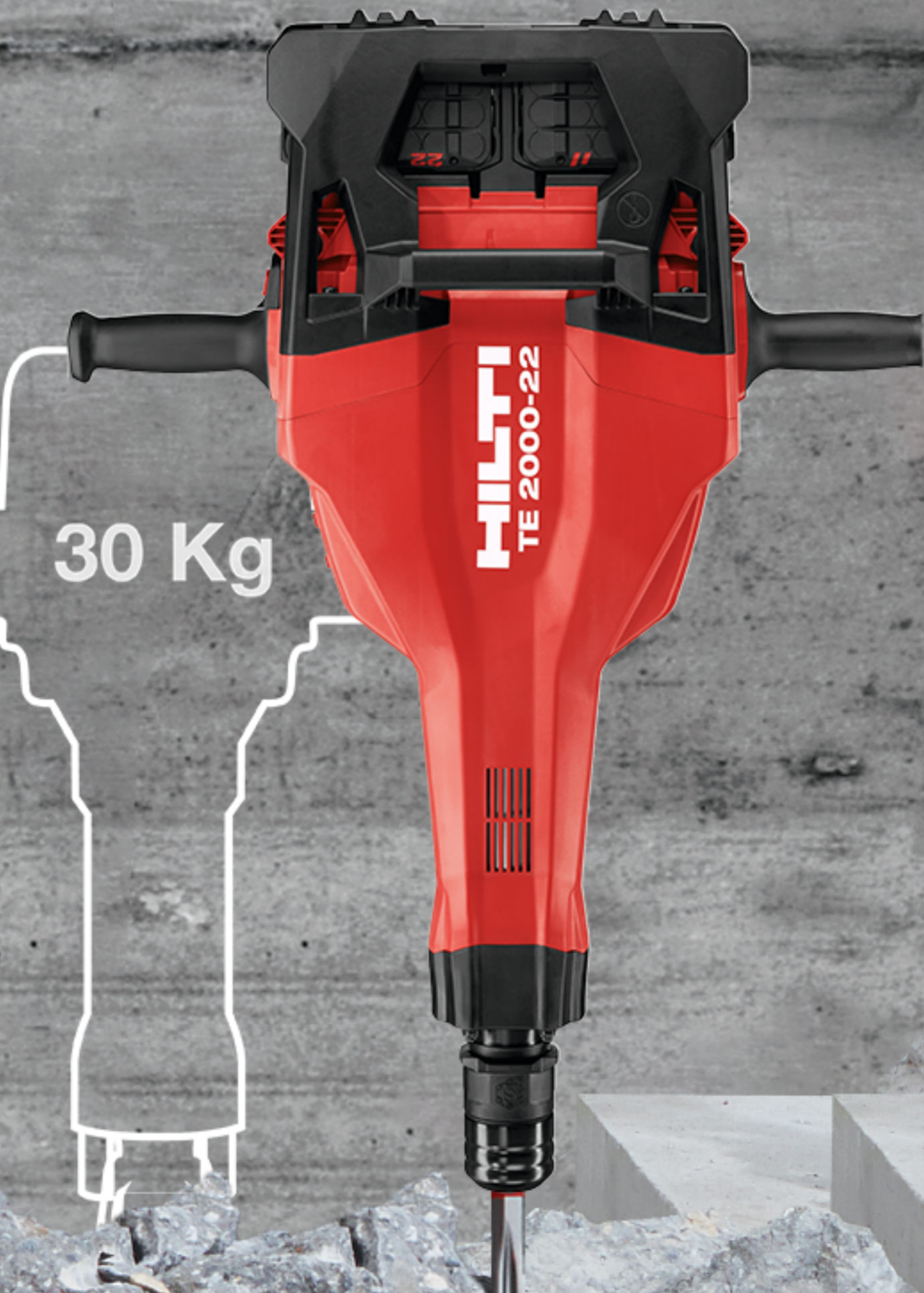
TE 2000-22 22Kg

Misma capacidad de demolición con la mitad del peso