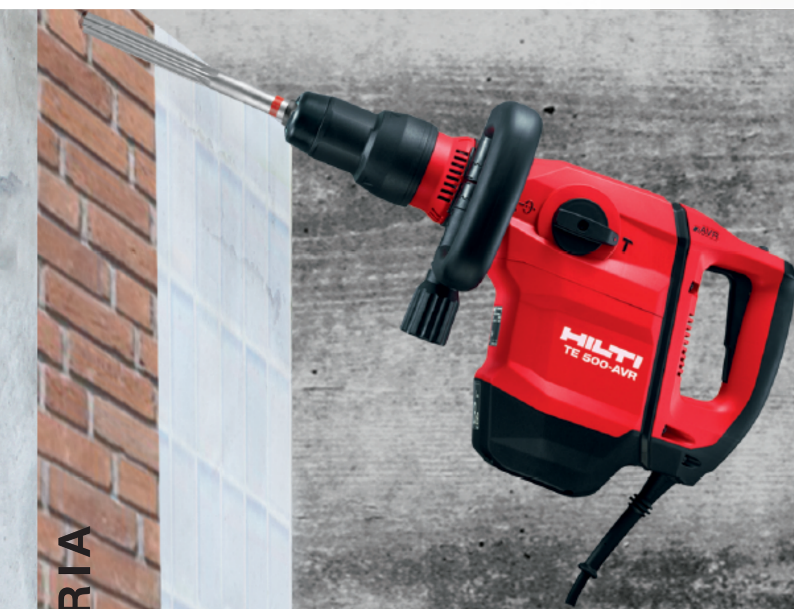
TE 500-AVR 5Kg