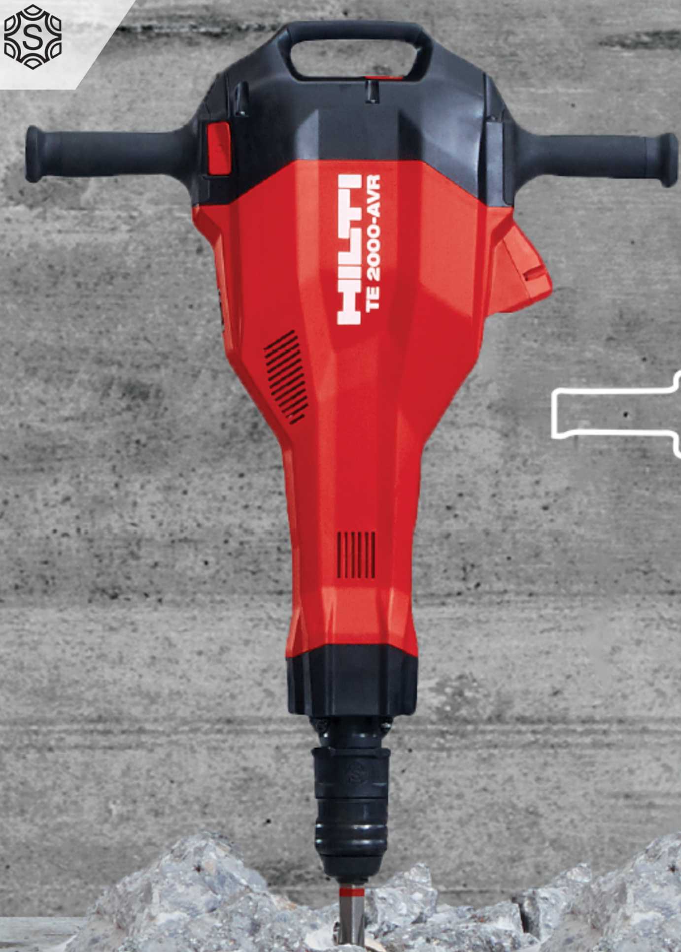
TE 2000 15Kg

Misma capacidad de demolición con la mitad del peso