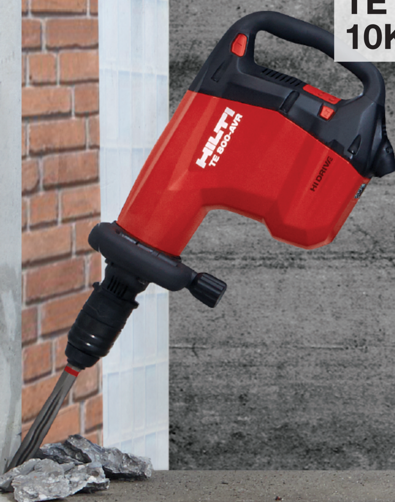
TE 800 10Kg