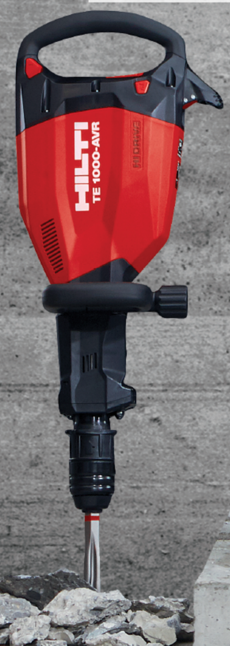
TE 1000 12Kg