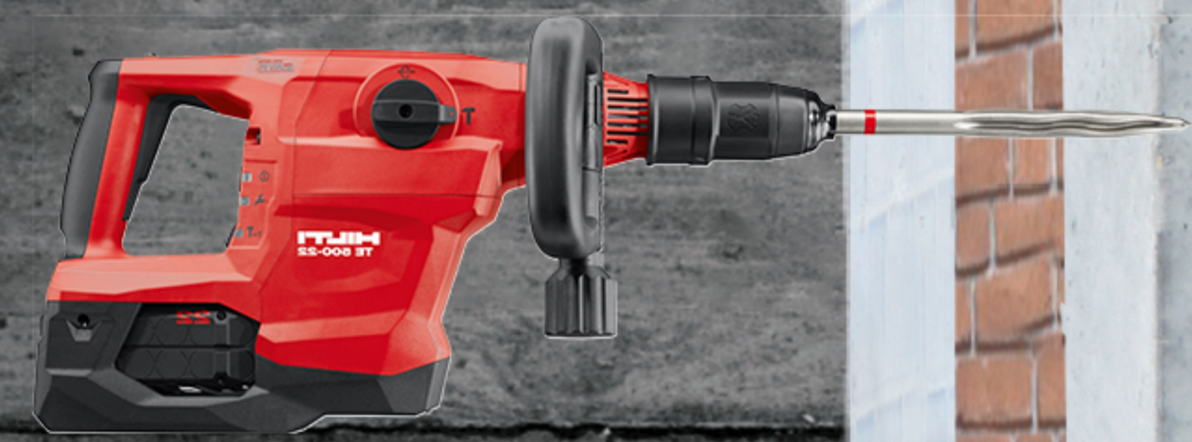
TE 500-22 7Kg